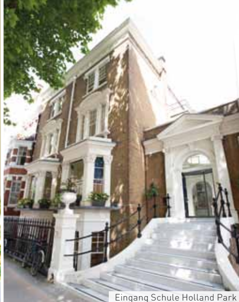
Eingang Schule Holland Park