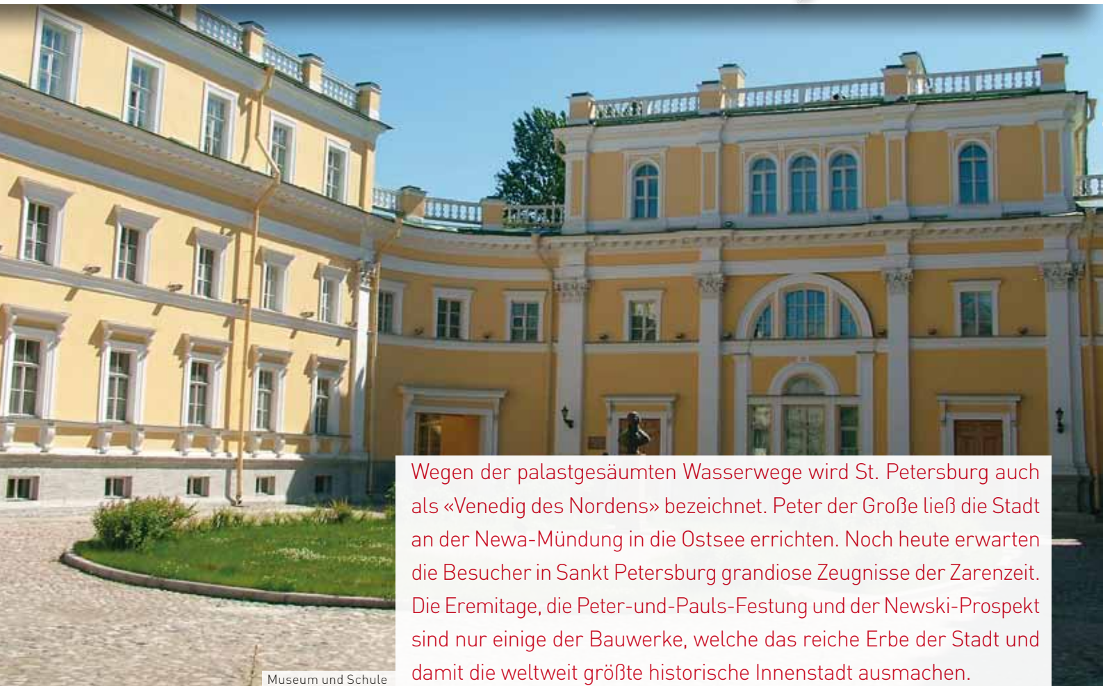
Museum und Schule

«Woraus besteht der Mensch? Aus Körper, Seele und Pass.» (aus Russland)