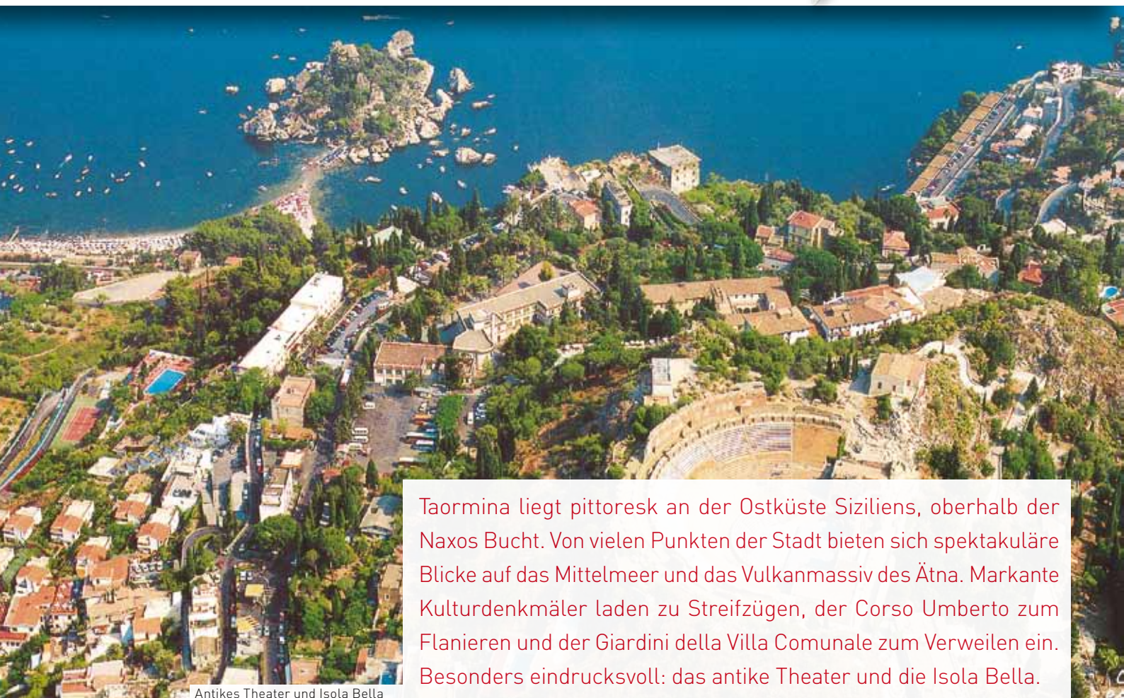
Antikes Theater und Isola Bella

«Daß ich Sizilien gesehen habe, ist mir ein unzerstörlicher Schatz auf mein ganzes Leben» (Johann Wolfgang von Goethe)