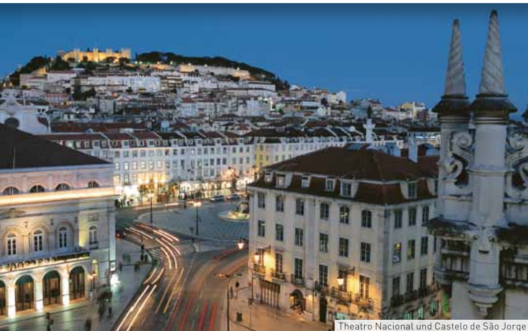
Theatro Nacional und Castelo de São Jorge