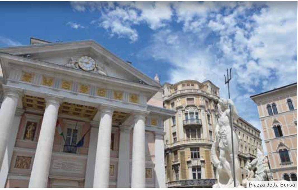
Piazza della Borsa