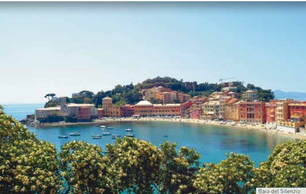
Baia del Silenzio